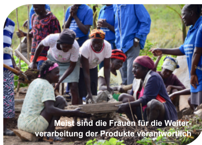
Meist sind die Frauen für die Weiterverarbeitung der Produkte verantwortlich

Diese Situation hält seit vielen Jahrzehnten an, und die Regierung tut sich schwer anzuerkennen, dass die Entwicklung des Landes auf lokaler Ebene beginnen muss, indem sie den Produzenten die notwendigen Mittel zur Steigerung der landwirtschaftlichen Produktion zur Verfügung stellt. Außerdem verfügt die haitianische Regierung nicht über ein entsprechendes Budget, um den Agrarsektor in Haiti nachhaltig zu entwickeln.