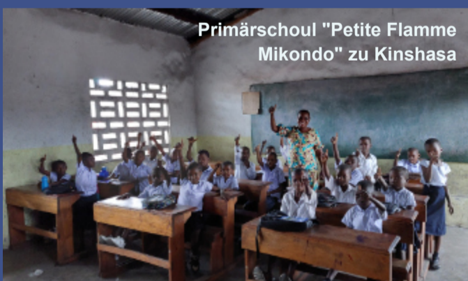
Primärschoul "Petite Flamme Mikondo" zu Kinshasa

Zu Kinshasa hu mir déi 2 Schoule besicht vun eisem Partner AECOM déi d'AMU an deenen nächste Joren ënnerstëtzt. Geplangt ass de Bau vu jeeweils 2 Klassenäll an 2 verschiddene Primärschoulen. Dës leien a Quartiere bësse méi um Rand vun der chaotescher 15 Milliounen Hauptstadt. Och hei sinn d'Besoine grouss wat ee schonn eleng un der Unzuel u Kanner gesäit déi sech deels ee Klassenäll deelen (bis zu 65 Schüler).