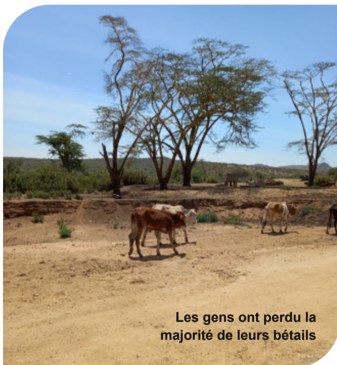
Les gens ont perdu la majorité de leurs bétails

Une sécheresse pluri-saisonnière touche depuis quatre ans l'est de la Corne de l'Afrique dont notre pays partenaire, le Kenya. Cette sécheresse a été déclarée une catastrophe naturelle, la pire depuis 40 ans. Au cours des trois dernières années, le Kenya n'a reçu aucune pluie dans la majeure partie du pays. Les populations touchées par la sécheresse ont subi des chocs consécutifs depuis 2016, tels qu'une sécheresse pluriannuelle suivie par des inondations, le COVID-19, une invasion de criquets pèlerins en 2020 et une forte inflation en 2022.