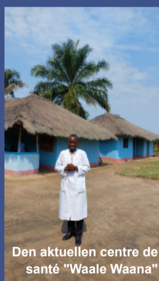
Den aktuellen centre de santé "Waale Waana"