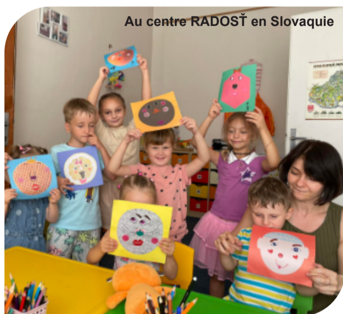
Au centre RADOST en Slovaquie

Et c'est là que le centre pour mères et enfants "RADOST" en Slovaquie veut apporter une aide.