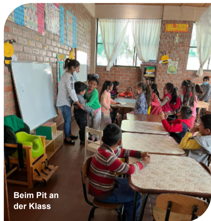
Beim Pit an der Klass

Nieft menger Haaptbeschäftigung fir d'„Casa de los Niños“ engagéieren ech mech och nach all Weekend fräiwëlleg bei „Chicos de la Calle“. Hei treffen sech haaptsächlech Jugendlecher, ëmmer fräiwëlleg op engem Freiden. All zesumme kache mir da fir d'Leit vun der Strooss. Dëst lesse gi mir dono an d'Stad ausdeelen. Fir dass mir net mat engem risege Kachdëppen duerch d'Stad lafe mussen, fuere mir mat engem Minibus fir 10-20 Leit déi verschidde Plazen an der Stad un wou sech Leit oni fest Doheem ophalen. Dobäi handelt et sech meeschtens ëm Familljen aus de rurale Gebieter déi fir eng Zäit an d'Stad komme fir Geld ze verdéngen a sech dowéinst keng Wunneng leeschte kënnen, ëm Mënschen déi aus politeschen oder finanzielle Grënn op der Strooss gelant sinn an/oder och ëm e groussen Deel vun Drogen-ofhängegen.