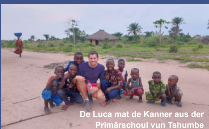
De Luca mat de Kanner aus der Primärschoul vun Tshumbe

Zu Tshumbe ware mir eis déi verschiddenst "centre de santé" esou wéi d'Klinik ukucke fir eis e Bild vun der medezinescher Situatioun ze maachen: d'Infrastruktur ass meeschtens ganz schlecht ausgebaut, et feelt u Material (oft ass net mol eng Wo oder en Thermometer disponibel), d'Personal ass schlecht ausgebild an d'Hygiène ass oft miserabel. D'Besoine sinn enorm a mir sinn immens frou dass dës wichtege Projet gestart ginn ass an de Bau lancéiert ass. Um Bau leeft alles manuell an dat ass impressionant nozekucken, zu Tshumbe gëtt et nämlech keen Elektresch, kee fléissend Waasser, keen asphaltéiert Stroossenetz, etc.