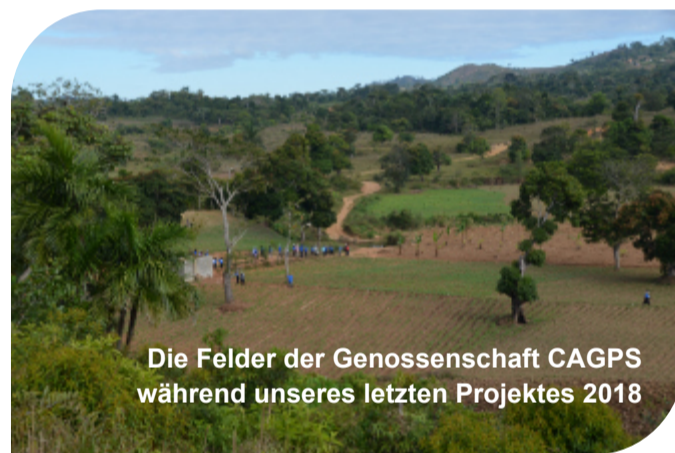
Die Felder der Genossenschaft CAGPS während unseres letzten Projektes 2018

Die Landwirtschaft war schon immer einer der wichtigsten Wirtschaftszweige in Haiti, aber das Land ist nicht in der Lage, seine Bevölkerung zu ernähren. So ist man gezwungen, den Hauptteil der benötigten Agrarprodukte zu importieren. Mehr als 40% der Bevölkerung lebt in chronischer Ernährungsunsicherheit. Folglich ist es wichtig den Menschen beim Aufbau und bei der Stärkung von landwirtschaftlichen Strukturen zu helfen.