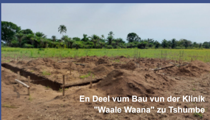
En Deel vum Bau vun der Klinik "Waale Waana" zu Tshumbe