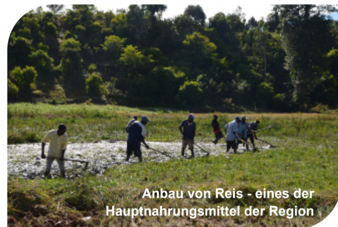
Anbau von Reis - eines der Hauptnahrungsmittel der Region

Gemeinsam mit der deutschen Organisation „Starkmacher e.V.“ wurde dieses Projekt bei „Bengo – Engagement Global“ zur Kofinanzierung eingereicht, es wurde im Juli 2022 angenommen.