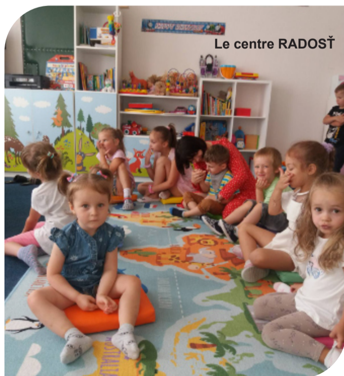
Le centre RADOST

Il s'agit d'une équipe très dynamique qui est convaincue de l'importance de soutenir ces femmes et ces enfants en cette période difficile. L'état de ces familles dépend de la santé mentale, émotionnelle et physique des femmes et des mères.