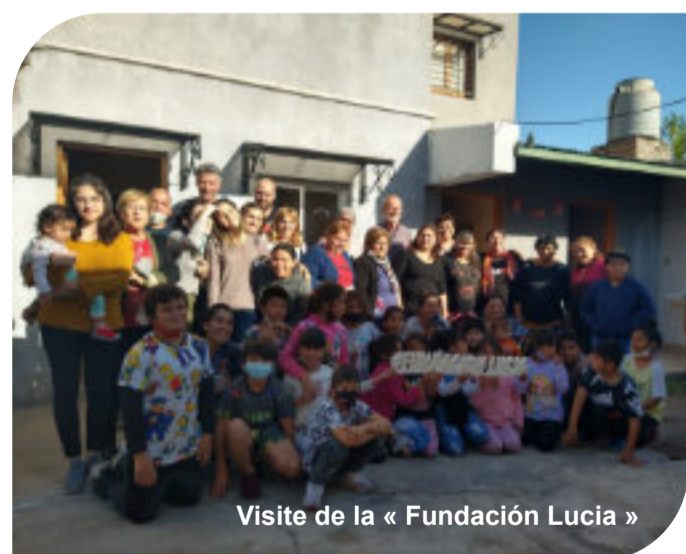
Visite de la « Fundación Lucia »