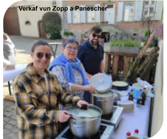
Verkauf vun Zopp a Panescher

Dank dësen Aktivitéiten an deene villen Donen koumen iwwer 30.000 € eran déi d'AMU dunn un di verschidde Partner weider ginn huet. Hei ass et interessant eng Kéier genau ze kucke wou di Suen hi gaange sinn.