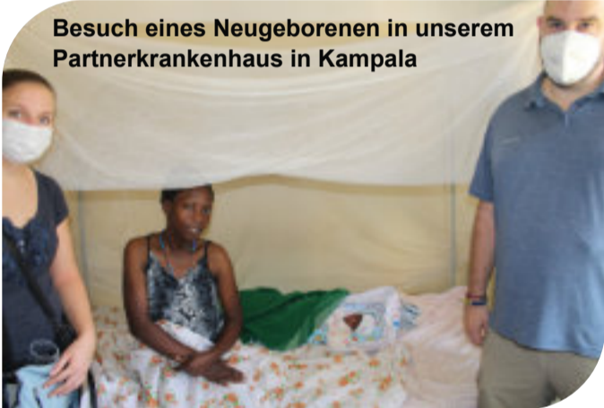
Besuch eines Neugeborenen in unserem Partnerkrankenhaus in Kampala