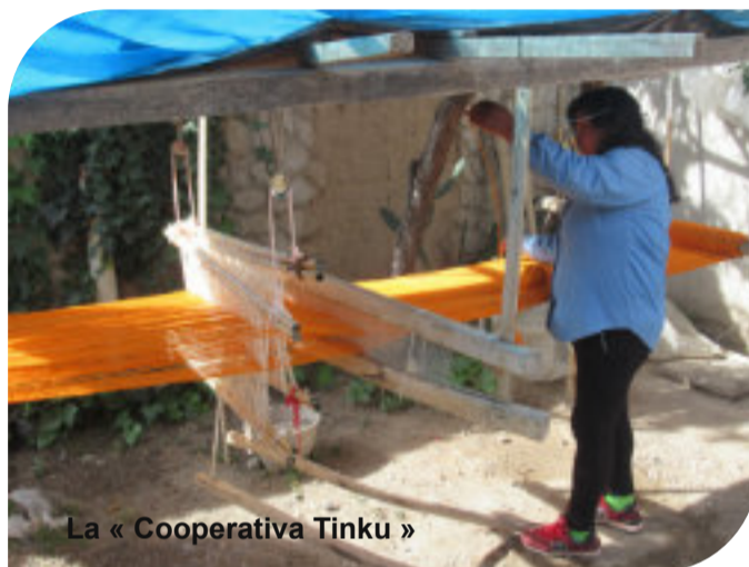
La « Cooperativa Tinku »

Autre aspect frappant : l'efficacité du principe du renforcement des capacités. Prenant sa source auprès de AMU, passant par Suma Fraternidad, jusqu'aux organisations locales, le projet réussit ainsi à toucher un nombre énorme de bénéficiaires. Nos moyens sont bien investis avec ce qu'on pourrait décrire comme un vrai effet de levier. A titre d'exemple, je cite le projet « Por Igual Mas » à Cordoba, qui a réussi à former plus de 500 professeurs, instituteurs, etc. dans le domaine de l'éducation intégrative de personnes handicapées. Le résultat est que ces derniers puissent participer à des ateliers et formations, être embauchés et être entièrement intégrés dans la société et la vie économique.