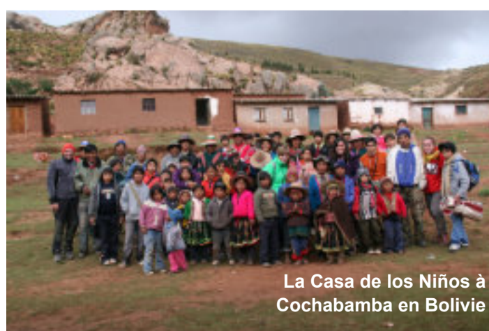
La Casa de los Niños à Cochabamba en Bolivie