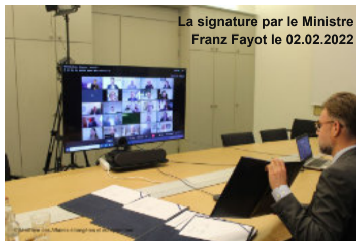
La signature par le Ministre Franz Fayot le 02.02.2022