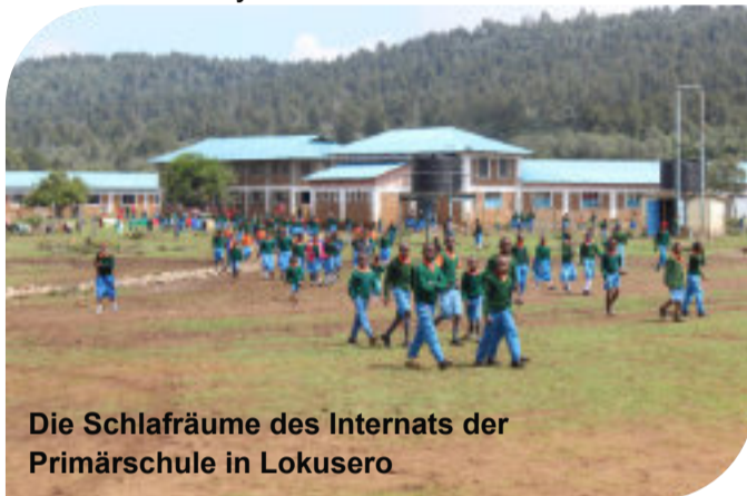
Die Schlafräume des Internats der Primärschule in Lokusero

Zuversichtlich, was die Wichtigkeit dieses Projektes anbelangt, geht die Reise für uns beide zum ersten Mal weiter nach Kenia. Hier startete Anfang 2022 ein neues Projekt mit einem der AMU bereits bekannten Partner. Die Primärschule auf dem Maasai Gelände in Lokusero erhielt 2009, dank der AMU, Schlafräume für das Internat. Dieses Jahr wird die stetig wachsende Schule zwei neue Klassenräume, zwei neue Personalwohnungen sowie ein Abwassersystem erhalten.