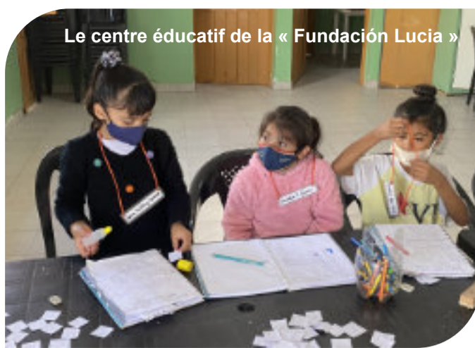
Le centre éducatif de la « Fundación Lucia »

L'aspect le plus impressionnant, et sûrement le plus important, est le professionnalisme, l'engagement et la motivation que nous avons vus auprès de Suma Fraternidad et des organisations locales. La situation socio-économique est très compliquée en Argentine et s'est encore gravement dégradée pendant la pandémie. Dans un tel contexte il est d'autant plus gratifiant de voir que la solidarité n'en fut guère impactée et que les gens continuent à s'entraider dans des conditions d'autant plus difficiles.