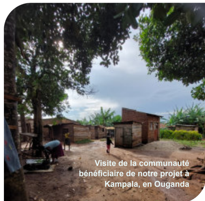
Visite de la communauté bénéficiaire de notre projet à Kampala, en Ouganda

A Kampala, nous rajoutons un projet de suivi à notre ancien projet qui vient de se terminer. Il s'agit d'un renforcement des capacités pour le personnel de l'hôpital Zia Angelina, ainsi que d'un accès amélioré à des soins médicaux de qualité pour les personnes vulnérables et à des formations professionnelles.