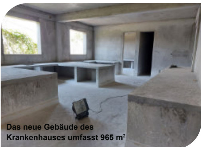
Das neue Gebäude des Krankenhauses umfasst 965 m 2