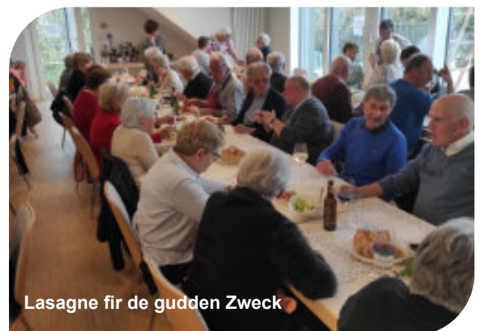
Lasagne fir de gudden Zweck

Am Ufank si Sue gebraucht gi fir deene ville Flüchtlinge weider ze hëllefen. Vill waren der op der Rees bei hir Famill an aner europäesch Länner. Hei ass et drëms gaange fir Leit fir kuerz Zäit opzehuelen, déi da weider wollten, oder si bis bei de nächste Bus oder Zuch ze féieren.