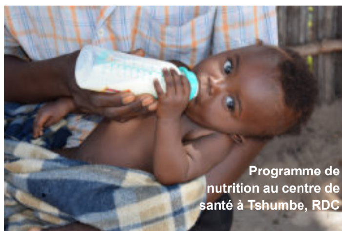
Programme de nutrition au centre de santé à Tshumbe, RDC