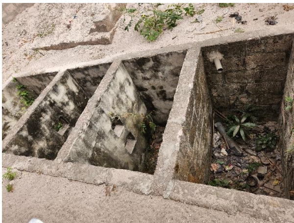
Oben: die vorhandenen sanitären Anlagen Inklusive Regenwasserspeicher Links: Der Sickerschacht für die begonnenen sanitären Anlagen am hinteren Gelände.

Das große Problem in Mikondo ist, dass nicht genügend Platz vorhanden ist, vor allem um ein weiteres Gebäude zu errichten. Dafür gäbe es nur zwei Möglichkeiten: entweder einen oberen Stock bauen, oder eine hintere Mauer abreißen und von den umliegenden Nachbarn weiteren Grund dazu kaufen, wo jetzt noch nicht klar ist, ob das möglich ist bzw. ob alle überhaupt verkaufen würden. Die dortige Situation scheint sehr herausfordernd und der Wunsch/Vorschlag der Organisation AECOM das Schulgebäude mit vier Klassenräumen in der Grundschule in Ndjili zu errichten erscheint dadurch noch viel plausibler. Beim Besuch haben wir uns darüber mehrmals innig unterhalten, über die Vor- und Nachteile und die Risiken.