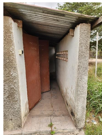
Die derzeit funktionierenden sanitären Anlagen (oben). Unten die veralteten sanitären Anlagen, welche anscheinend nicht mehr benützt werden.