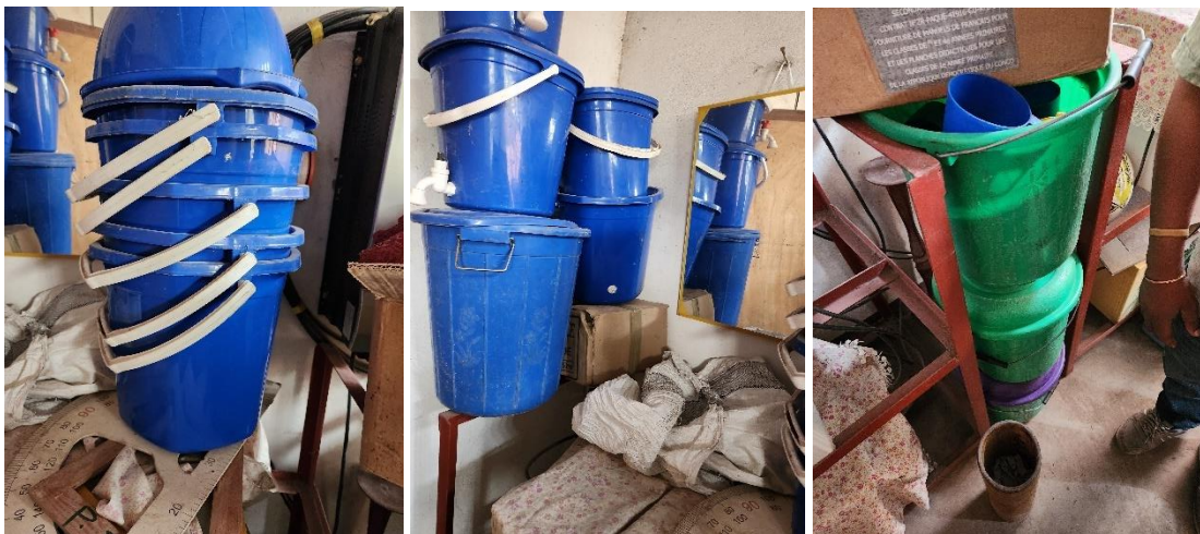
Handwaschstationen des Covid-19 Projekts in der Grundschule Petite Flamme in Ndjili