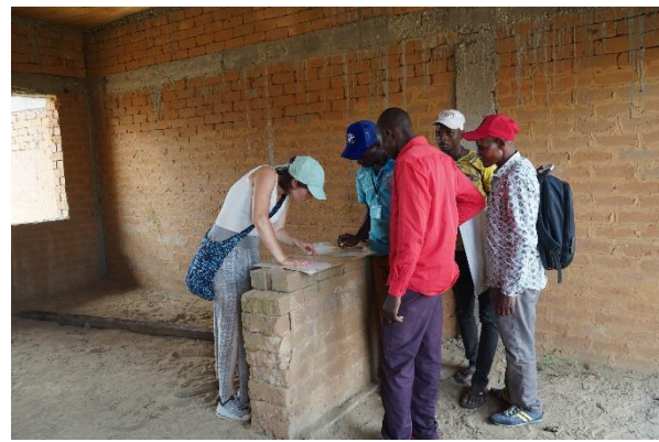
Patientenräume in der Bauphase im Gesundheitszentrum in Tshumbe

Das Gesundheitszentrum wird rund 60 - 70 Patienten stationär in den Räumlichkeiten aufnehmen können. Nach Besprechungen mit der lokalen Bevölkerung sowie auch mit mehreren Ärzten vor Ort, wurde festgestellt, dass bei einem Patientengebäude ein paar kleine Planänderungen notwendig sind, denn dieses Patientengebäude soll Einzelzimmer und Zweibettzimmer zur Verfügung haben, damit die Patienten, die allein ein Zimmer haben wollen und dafür auch bezahlen können die Privatsphäre erhalten, die sie sich wünschen. Die Bezahlung für einen solchen Patientenaufenthalt wird höher sein und soll damit auch die Aufrechterhaltung des Gesundheitszentrums unterstützen.