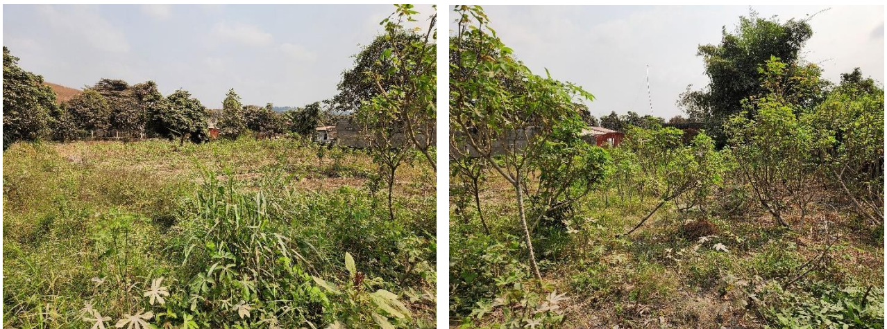
Das vorhandene Land, welches für den möglichen zukünftigen Bau zur Verfügung steht.

Generell gibt es in der D.R.Kongo bei jedem Projektaufbau Risiken, aufgrund der instabilen politischen Lage, der hohen Inflation, der unzureichenden Infrastruktur und den mangelnden medizinischen Gegebenheiten, diese müssen bei jedem Projekt miteinkalkuliert werden. Abgesehen davon empfinde ich, dass AECOM diesen Klassenbau gewissenhaft durchführen wird und auch all diese möglichen Risiken mitbedacht hat.