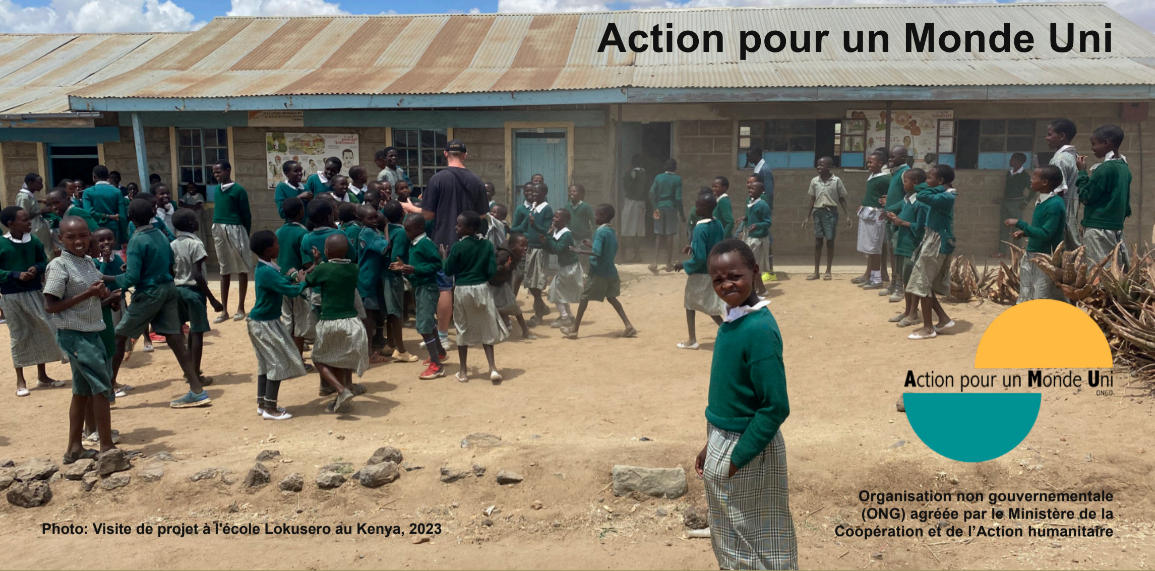
Photo: Visite de projet à l'école Lokusero au Kenya, 2023