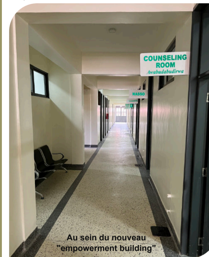
Au sein du nouveau "empowerment building"

Les patients VIH positifs doivent faire face à des niveaux élevés de chômage et de pauvreté, et à des travaux peu rémunérés. La stigmatisation reste un problème fréquent au sein de la communauté. Pour cette raison, il faut adresser le sujet d'un point de vue holistique et pas exclusivement médical. Cette réflexion a amené notre partenaire à utiliser la salle de formation du nouveau « empowerment building » pour aller une étape plus loin. Ce projet offre aux patients des formations professionnelles dans les domaines de l'agriculture, la couture, l'artisanat, la production de savons et l'entrepreneuriat. Le but est de réintégrer les patients dans la société et de leur permettre de retrouver leur dignité et un moyen de survie.