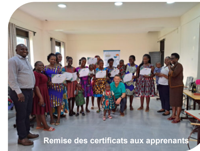
Remise des certificats aux apprenants

En 2023, 6,6 % des femmes âgées entre 15 et 49 ans vivent avec le VIH/SIDA en Ouganda, tandis que 3,6 % des hommes sont touchés par le virus (UNAIDS 2023).