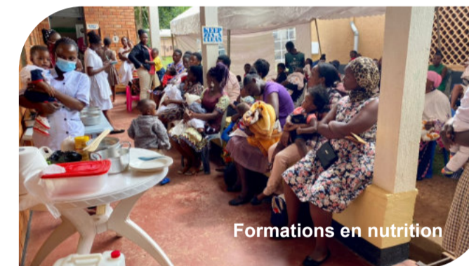
Formations en nutrition

A côté de ces 5 domaines de formation, chaque année plus de 300 femmes et personnes s'occupant d'enfants en bas âge sont formées à la nutrition thérapeutique. Les mamans apprennent à nourrir leurs enfants de manière saine et équilibrée afin de prévenir les cas de malnutrition. Ces formations se tiennent lors des journées de vaccination à l'hôpital, tous les vendredis. Ainsi, nous pouvons atteindre un grand nombre de bénéficiaires. Le dernier vendredi du mois, une cuisine de démonstration pratique est réalisée avec la pleine participation des mères.