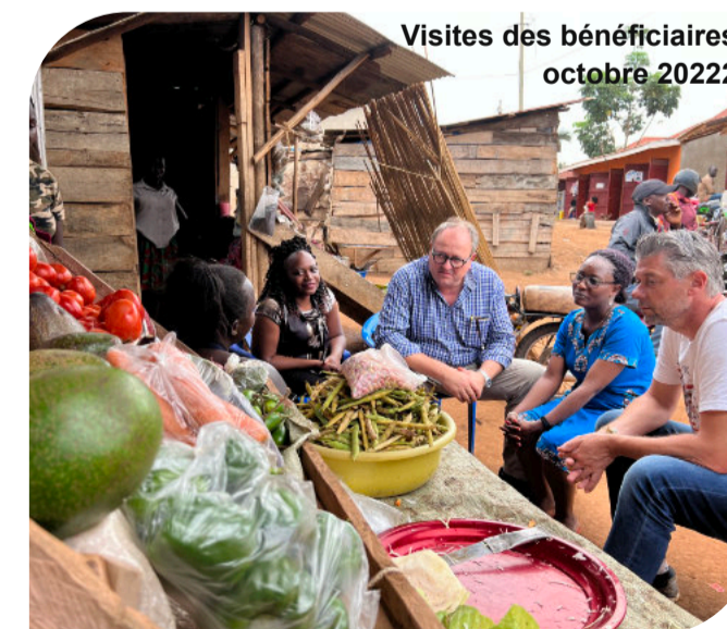
Visites des bénéficiaires octobre 2022