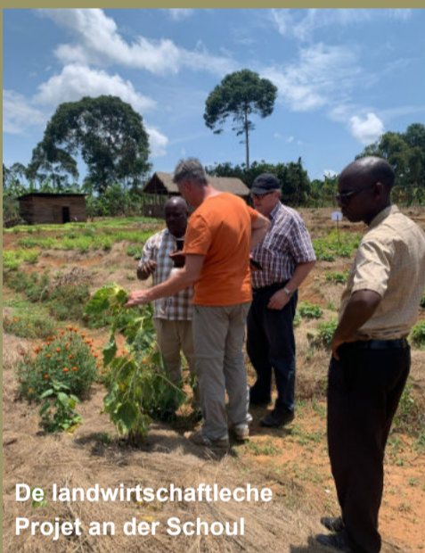
De landwirtschaftleche Projet an der Schoul