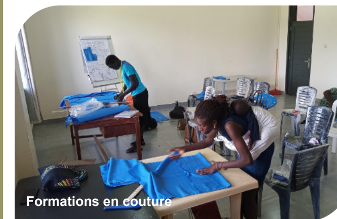
Formations en couture

Lors de la première visite en 2023, 114 bénéficiaires avaient terminé les formations avec succès et ont reçu un kit de départ pour se lancer dans des activités économiques. Les personnes touchées ont également été formées à l'entrepreneuriat et au marketing pour leur permettre de vendre leurs produits sur le marché. Parmi les 114 bénéficiaires, il y a 105 femmes et 9 hommes. On note que les femmes et les filles sont beaucoup plus touchées par le VIH/SIDA et ses conséquences. Ceci est dû au fait que les femmes se voient dans beaucoup de régions confrontées à un accès limité à l'éducation, ainsi qu'aux services de santé et à la protection sociale. De plus, elles sont souvent victimes de violences sexuelles et d'abus sexuels.