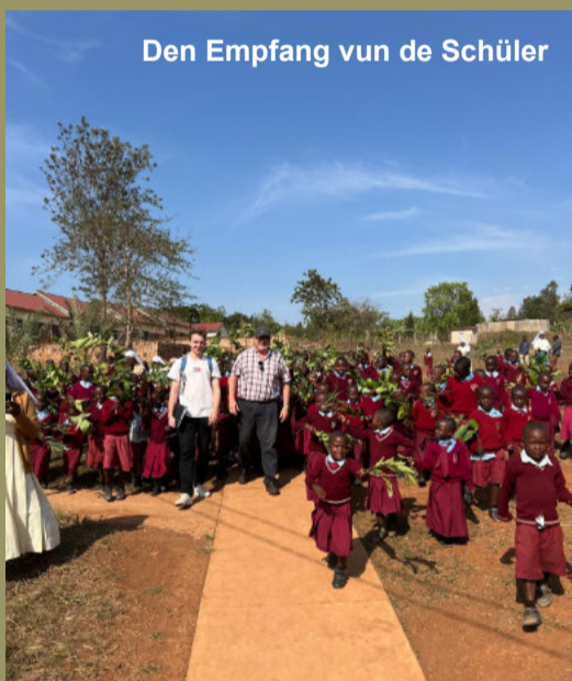
Den Empfang vun de Schüler